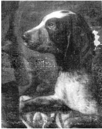
"Tobias y el Angel" (fragmento) pintura de Jerónimo J. De Espinosa, con un perro pachón clásico, 1630 h.

Consecuentemente, se empezaron a estimar mucho los perros capaces de detectar la caza y mantenerla quieta o en expresión de la época, para ella, permitiendo así que el balletero pudiese aproximarse y alcanzarla. Barahona de Soto (1587) habla por primera vez del perro "perdiguero" y describe los mejores "que tienen más instinto pero peor condición; entre los navarros, de más viento pero menos sufridos..." El perro de punta ibérico aparece en numerosos cuadros barrocos, especialmente conocido es la pintura del príncipe Baltasar Carlos en traje de caza, de Velázquez.