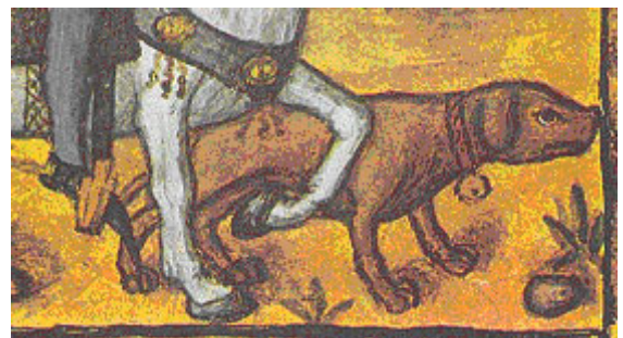
Códice miniado de la Catedral de Toledo, siglo XV (fragmento), primer documento en el mundo de un perro en actitud de muestra, cazando con halcón.