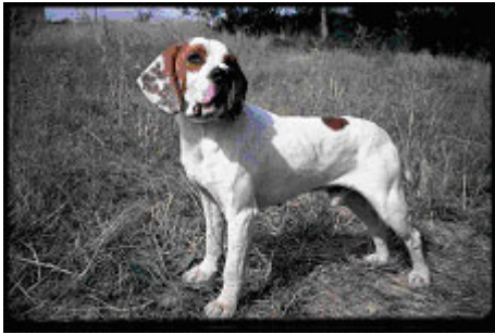
"Alajú Yaco" (1980) uno de los primeros productos de la cría moderna

En 1983 fue editado un sello postal por la Fabrica Nacional de Moneda y Timbre acerca de la raza. En 2001 tuvo lugar la primera prueba monográfica de caza, abierta al público y a los expertos. En 2002 se fundó el Circulo de Cazadores y Criadores de Pachón Navarro, que aprueba su patrón racial oficial. Hacia 2003 ya se ha alcanzado un millar de ejemplares criados y registrados. Hoy día la raza está completamente recuperada, se ha regenerado la memoria cultural, histórica y funcional de la raza. Hay nuevos criadores, se exportan perros al extranjero y se convocan pruebas de trabajo monográficas.