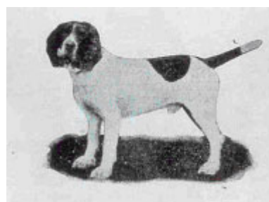
Ejemplares premiados en 1911 y 1918, respectivamente