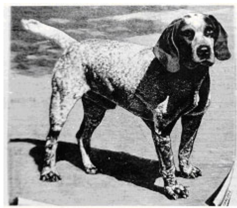
Pachones navarros premiados en la primera exposición canina de Madrid 1890