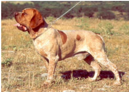
"Alajú Zubi" (1995) un ejemplar clave en el programa de cría y selección