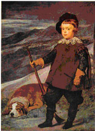
"El príncipe Baltasar Carlos en traje de caza", cuadro de Velázquez, hacia 1635.

Consecuentemente, se empezaron a estimar mucho los perros capaces de detectar la caza y mantenerla quieta o en expresión de la época, para ella, permitiendo así que el balletero pudiese aproximarse y alcanzarla. Barahona de Soto (1587) habla por primera vez del perro "perdiguero" y describe los mejores "que tienen más instinto pero peor condición; entre los navarros, de más viento pero menos sufridos..." El perro de punta ibérico aparece en numerosos cuadros barrocos, especialmente conocido es la pintura del príncipe Baltasar Carlos en traje de caza, de Velázquez.