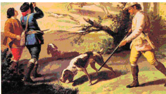
"Una partida de caza" (detalle), Francisco de Goya, 1770.

El antiguo perro español de punta (old spanish pointer). Fue dado a conocer principalmente a partir de la Guerra española de Sucesión (1711-1714), con la estancia prolongada de tropas extranjeras en España: ingleses, franceses y alemanes. Más tarde, exportado por los Borbones a las familias nobles europeas. El antiguo perro de muestra ibérico se convirtió en el padre del Pointer inglés (Arkwright, 1902) y del resto de las razas europeas de muestra.